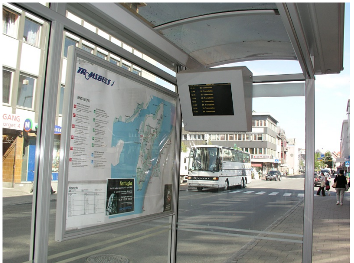
Leskur med sanntidsinformasjon: Foto Bente Skogdal

Glassflate markert: Nei Areal tilpasset rullestol: Nei Innvendig belysning: Ja Materialtype: Pleksiglass Reklameavtale: Nei Sittemulighet: Nei