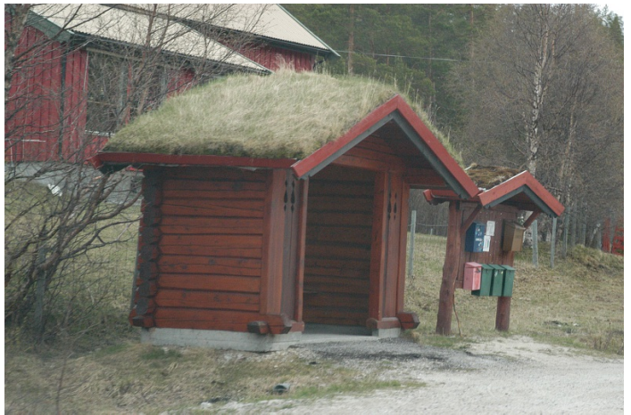
Leskur i tre.

Glassflate markert: Nei Areal tilpasset rullestol: Nei Innvendig belysning: Nei Materialtype: Tre Reklameavtale: Nei Sittemulighet: Nei