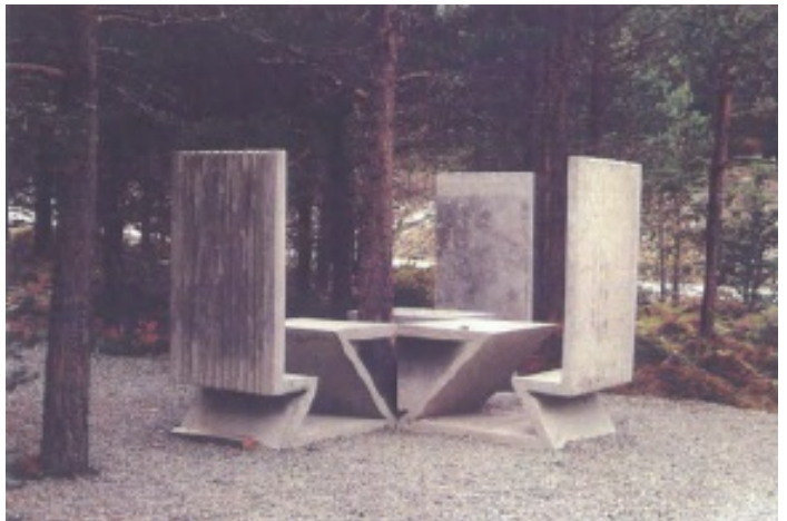
Sittegruppe, bord/stoler av materialtype betong

EksempelTekst Antall : 1 Eier: Fastmontert : Ja Fabrikant:: Leverandør: Materialtype: Betong Overflatebehandling: Produktnavn: Type : Sittegruppe, bord/stoler Vedlikeholdsavtale: Vedlikeholdsansvarlig: Vinterlagring : Nei