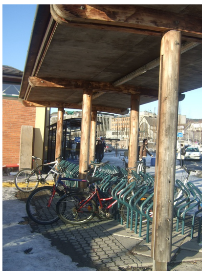
Sykelstativ under tak.

Antall sykler:36 Sykelstativ: Ja Antall sykler totalt: 36