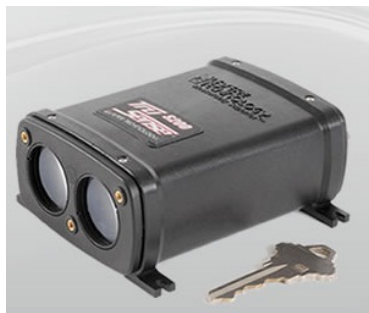
Vannstandsmåler med laser.