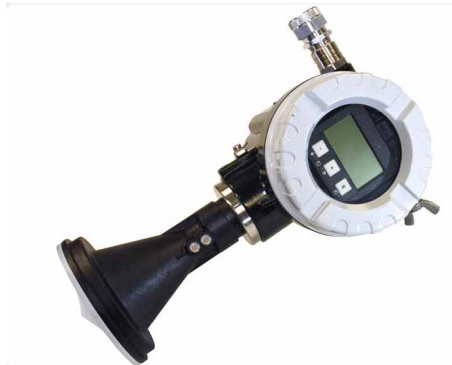
Vannstandsmåler med radar. Foto: Waterlog

Produktnavn: H-3611-S SDI-12 Produsentnavn: Waterlog Type: Radarsensor