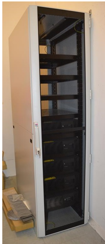
Liten UPS.

Batteri, antall: 1 Batteri, driftstid: 2 timer Batteri, kapasitet: 600 Ah Batteri, spenning: 12V Bruksområde: Nødstrøm Driftsattår: 2014 Produktnavn: Match 19" UPS 700 VA Produsentnavn: GE Digital Energy Spenning: 230 V Total effekt: 0.7 KVA