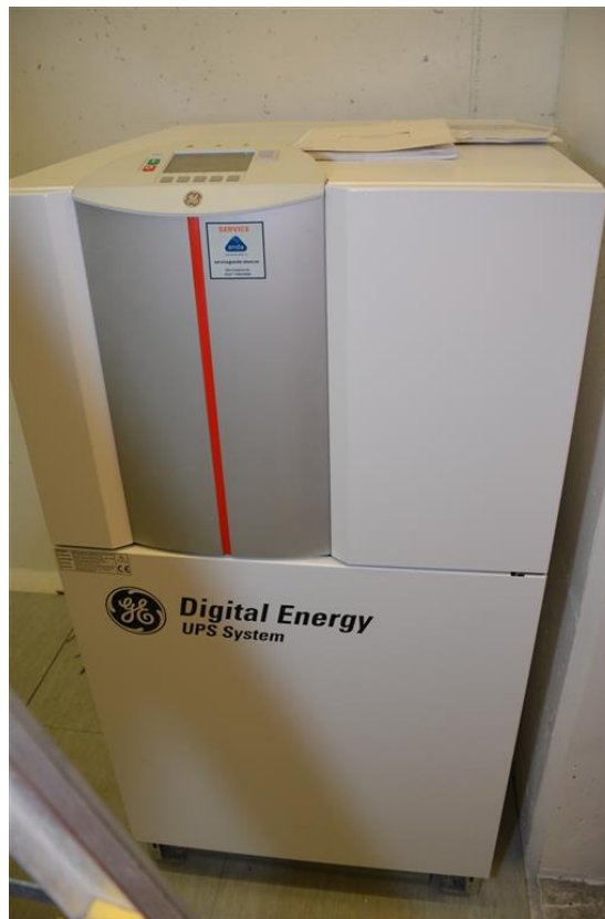
Stor UPS.

Batteri, antall: 1 Batteri, driftstid: 2 timer Batteri, kapasitet: 6000 Ah Batteri, spenning: 12V Bruksområde: Nødstrøm Driftsattår: 2014 Produktnavn: GE LP-33 40kVA Produsentnavn: GE Digital Energy Spenning: 230 V Total effekt: 40 kVA