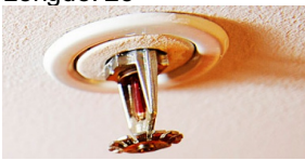
Brannsløkking med sprinkleranlegg i tak