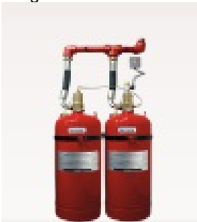
Brannsløkking med halon eller gass

Type: Hallogen brannsløkkingsanlegg Lengde: 21