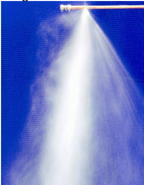
Brannsløkking med vanntåke