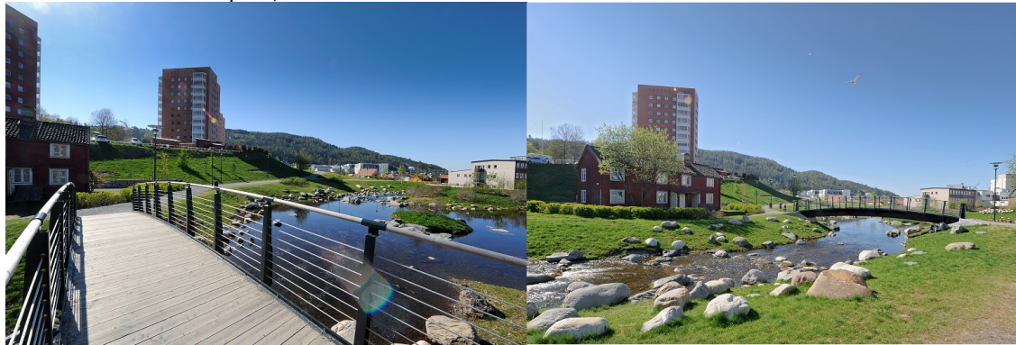
Prisbelønt grønntanlegg i Trondheim.

Sted/Adresse: Iladalen park, Ilevolden i Trondheim