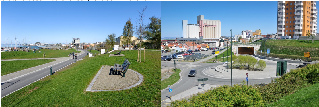
Grøntanlegg ved Ilevolden i Trondheim.

Sted/Adresse: Ved Skansen, Ilevolden i Trondheim