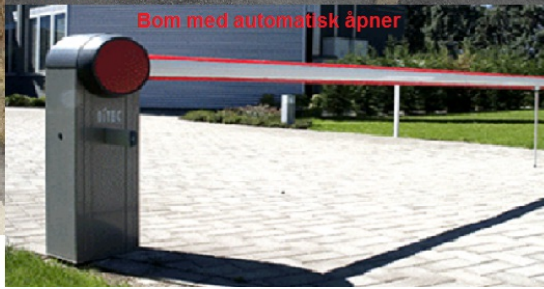
Bom med automatisk åpner