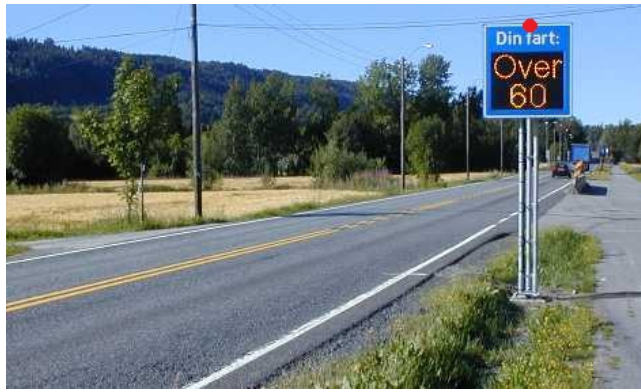
Fartstavle måles inn i senter topp tavle som vist her med rød prikk

Stasjonering: Fast Type måling: Sløyfe Produksjonsår: 2008 Produktnavn: Fartstavle med Datarec 7 Serienummer: