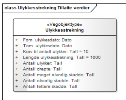
Figur 1: UML-skjema for Ulykkesstrekning