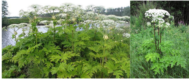
Tromsøpalme og kjempebjørnekjeks.

Artsnavn: Tromsøpalme / Kjempebjørnekjeks Areal: 8 / 1 Antall individ: 8 / 1 Bestandsbredde: 3 / 1 Delt forekomst: Ja / Nei Forekomst nr: 7 / 2 Bekjempelsesgrad: Bekjempes / Bekjempes Tetthet: Tett bestand/ Få Bekjempelse, type: Kantklipp/Kantklipp