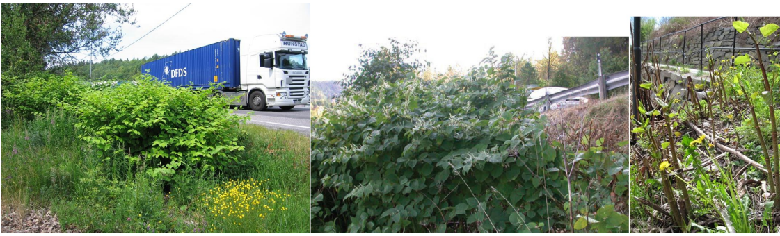
Park- og hybridlirekne.

Park- og hybridlirekne ( Fallopia japonica )