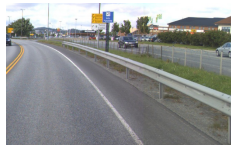
Trafikkdeler mellom hovedveg og lokalveg.

Belegning : Grønt/beplantning Bredde : 3 m Bruksområde : Trafikkdeler hovedveg/lokalveg Byggeår : 2010 Lengde : 420 m