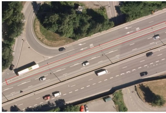
Trafikkdeler mellom parallelle strømmer.

Her registreres også kantstein som datter