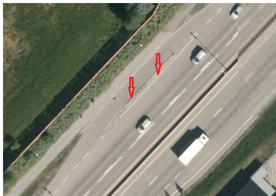
Trafikkdeler på busslomme.