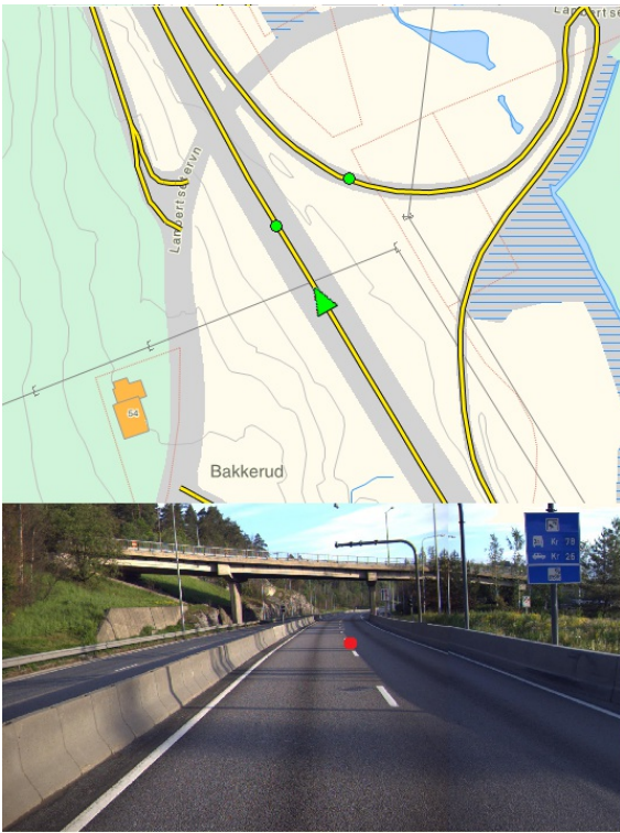
Eksempel på veg med to automatiske bomstasjoner. Rødt punkt viser anbefalt punkt for registrering geometri på hovedvegens (E6) bomstasjon.

Her er det vist et område der det er bomstasjon på hovedvegen og på en rampe. Dette registreres som to bomstasjoner. Det er bare to kjørefelt, og det kreves bompenger i bare en retning, mot metreringsretningen, så kjørefeltkoden blir 1 og 3 (1#3)