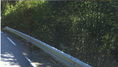
Redusert klippebredde på grunn av busker og trær.