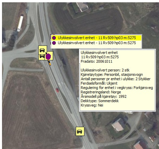
Figur 3: Data for ulykke med 2 ulykkesinnvolverte enheter

Eksemplet viser data fra en trafikkulykke med to enheter involvert i ulykken. Vi ser her at det er to personer involvert i den ene bilen, og disse vil da finnes igjen som ulykkesinnvolvert person.