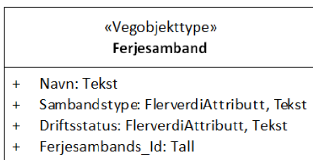
Figur 1: UML-skjema med betingelser