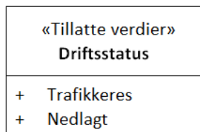
Figur 2: UML-skjema tillatte verdier