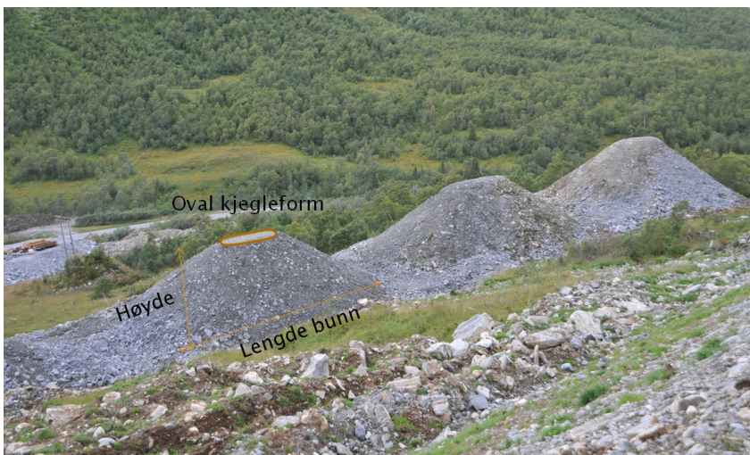
Figur 4: Eksempler på bremsekjegleregler sett ovenfra.