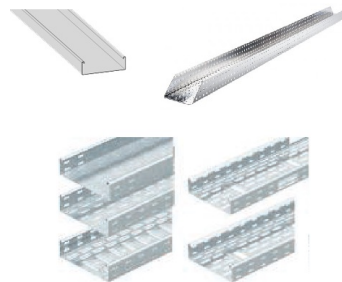
Figur 5: Bildet viser eksempler på kabelrenner

Kabelbru/Stige Bredde : 0.15/0.12/0.2/0.2 Lengde : 2/2/2/2 m Materiale : Stål, syrefast/Stål, galvanisert/Stål, syrefast/Stål, galvanisert/ Plassering : I tak/I tak/I tak/I tak Type : Renne/Renne/Renne/Renne