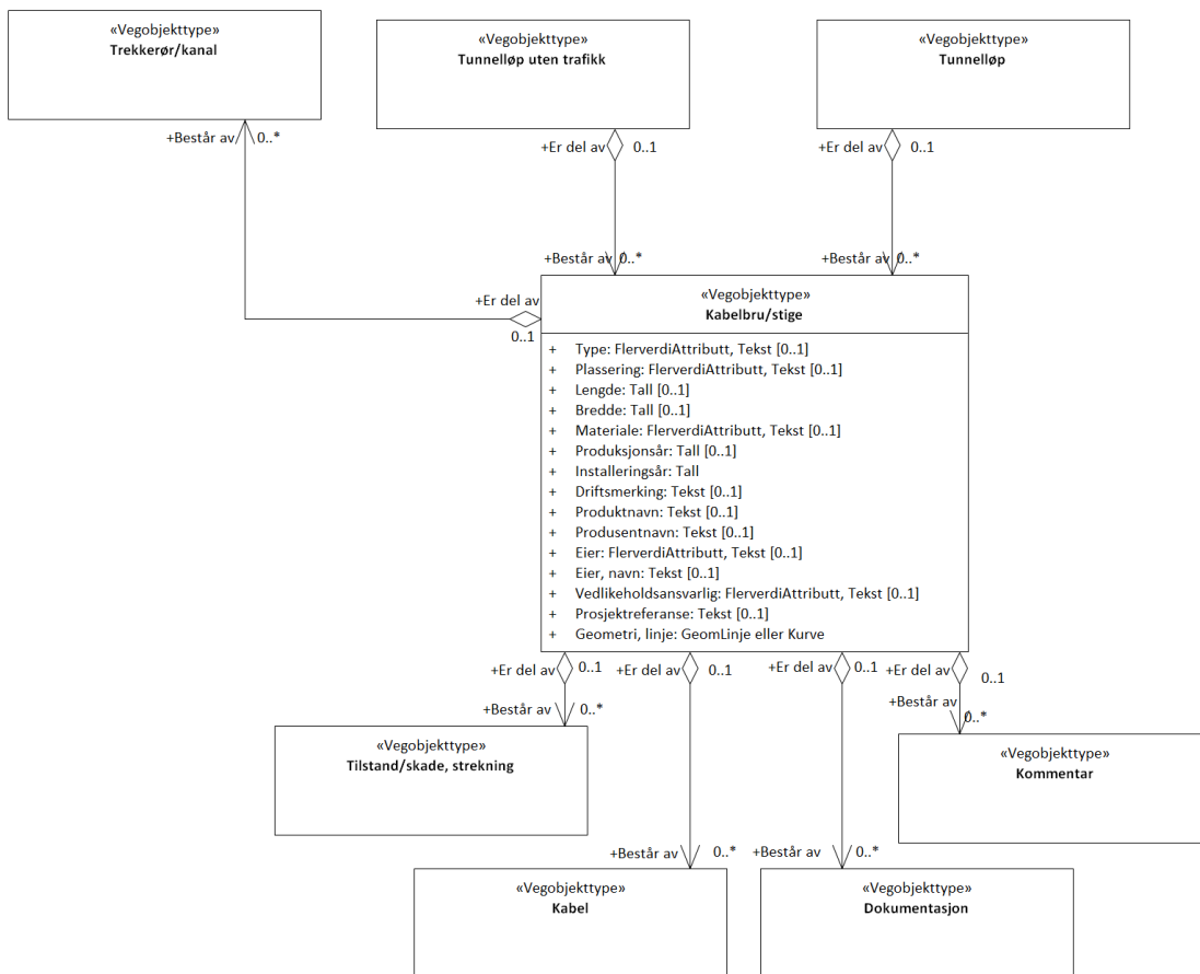
Figur 3: UML-modell med assosiasjoner