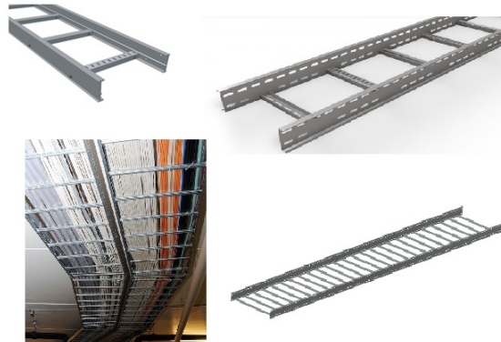
Figur 4: Bildet viser eksempler på kabelstiger

Kabelbru/Stige Bredde : 0.5/0.4/0.8/0.3 m Lengde : 3/3/12/3 m Materiale : Stål, syrefast/Stål, galvanisert/Stål, syrefast/Stål, galvanisert/ Plassering : I tak/I tak/I tak/I tak Type : Stige/Stige/Stige/Stige