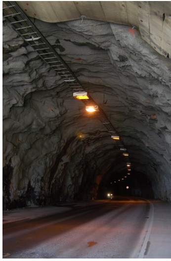
Figur 6: Kabelstige i tunneltak i Flekkerøytunnelen.

Kabelbru/Stige Bredde : 0.5 m Lengde : 230 m Materiale : Stål, syrefast Plassering : I tak Type : Stige