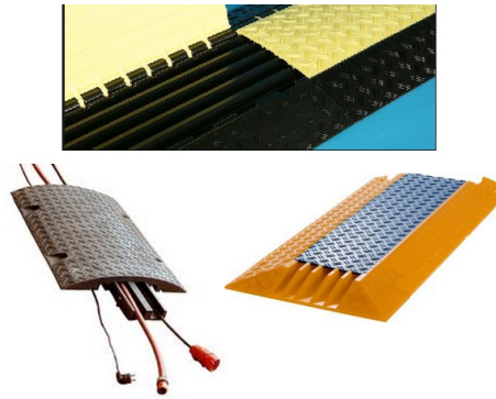
Figur 3: Bildet viser eksempler på kabelbruer

Kabelbru/Stige Bredde : 0.5/0.4/0.8 m Lengde : 1.5/0.8/ 2.1 m Materiale : Plast/Plast/Plast Plassering : På gulv/På gulv/På veg Type : Bru/Bru/Bru