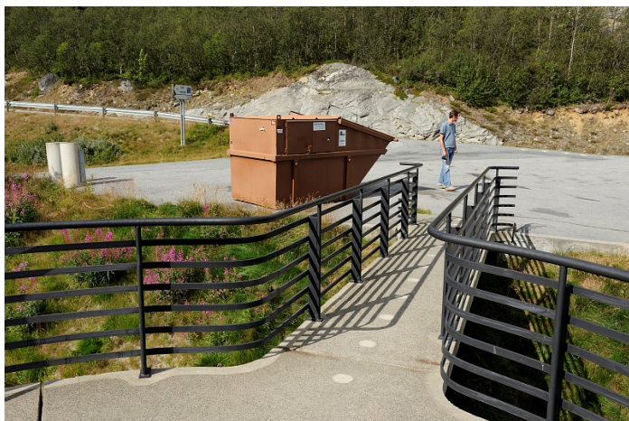
Avfallscontainer på rasteplass.