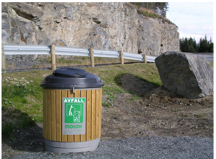
Molok på rasteplass.

Antall: 1 Type: Molok Tømmebehov: 1 Volum: 400