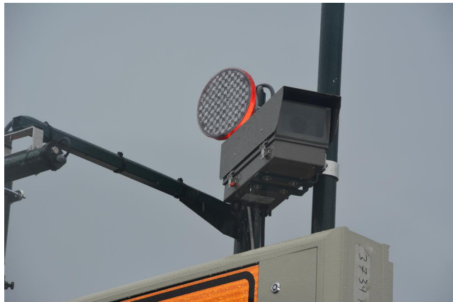
Luminansmåler utenfor tunnel.

Bildet viser en luminansmåler plassert utenfor Strindheimtunnelen i Trondheim