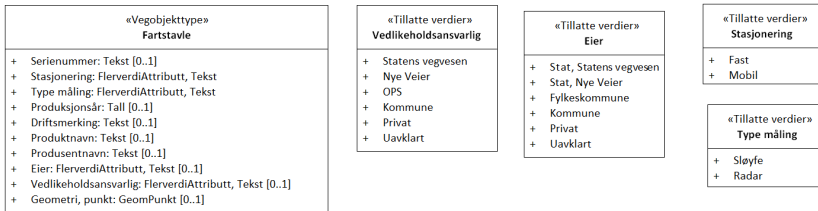
Figur 2: UML-skema tillatte verdier