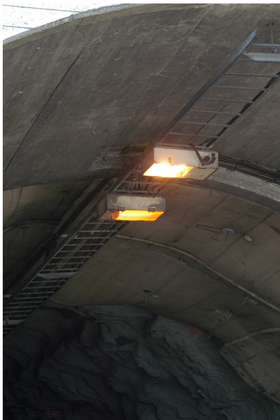
Lysarmaturer i Tunnel.

Bildet viser en eldre tradisjonell lyssetting av tunnel der lysarmaturene er festet til en kabelstige i taket på tunnelen