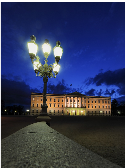
Lyssetting av område

Bildet viser en lysmast med 5 vakre lysarmaturer plassert for å lyse opp plassen foran det kongelige slott i Oslo