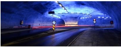
Lyssetting i Vallaviktunnelen.

Antall lyskilder per armatur : 1 Dimming : Nei Driftsattår : 2013 Driftsmerking : xxxxxx Effekt : 20 W Fargetemperatur : 8000 K Inngår i nødsystemet : Nei Lyskilde type : Lysstoffrør Utskiftbare lyskilder : Ja