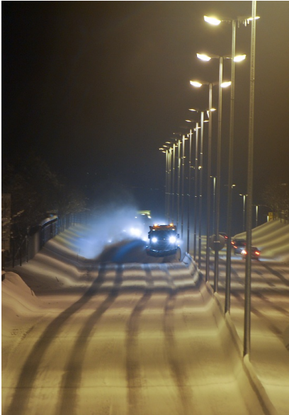
Lyssetting langs midtdeler på omkjøringsveien i Trondheim.

Bildet viser lysmaster med to lysarmaturer i hver mast plassert langs midtdeleren på en firefeltsveg