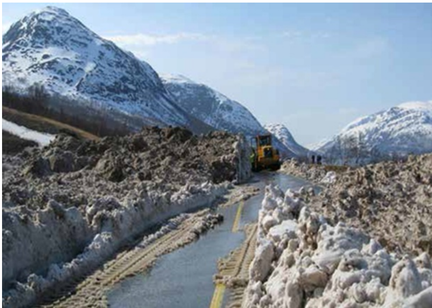
Sørpeskred, E6 Langfjorden, Finnmark, 16.05.2010 (Håndbok 139)

Vegreferanse: 1800 EV6 HP11 m13000 – 17120