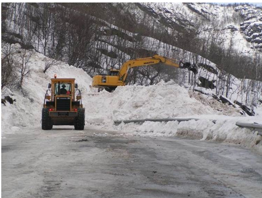
Tekst: Rasrydding på E16 Urtegscreda vinteren 2007. (Håndbok 139).