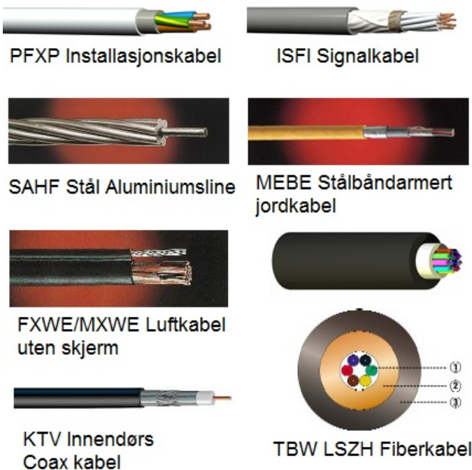
Figur 4: Eksempler på forskjellige typer kabel (fra Nexans)