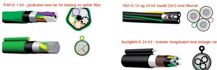
Figur 6: Kraftkabel med innlagt fiberrør

Kraftkabel med innlagt fiberrør kan øke verdien av nedlagt kabel fordi fiber enkelt kan blåses gjennom kabelen ved behov.