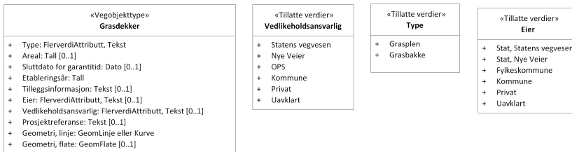
Figur 2: UML-skjema tillatte verdier