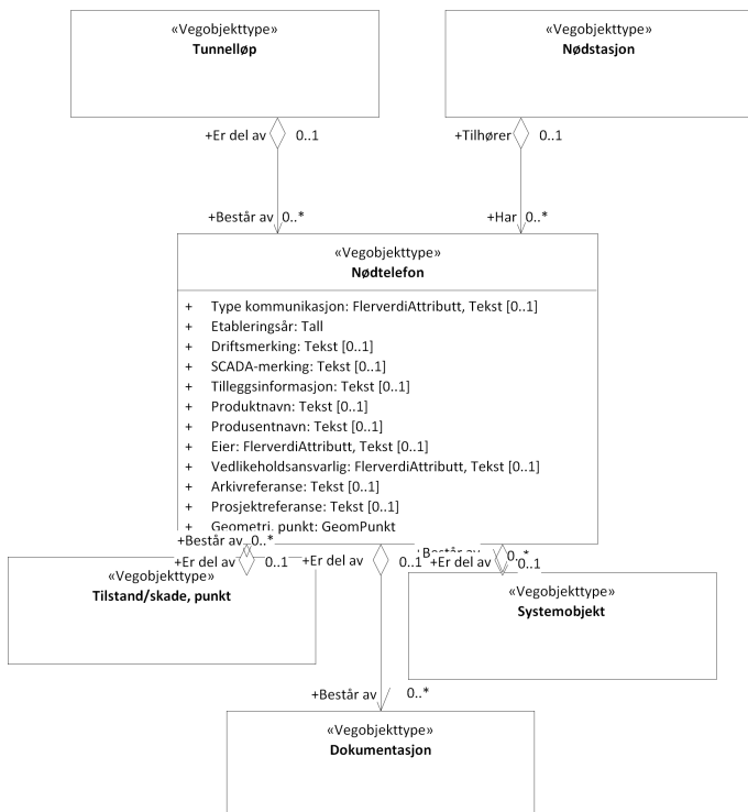
Figur 3: UML-skjema med assosiasjoner