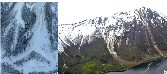
a) Ledevoll bygd som plog b) Ledevoll

Ledevoller brukes til å styre skredbevegelsen i utløpsområdet. Ledevoller kan også bygges som en plog og styre skredet i flere retninger.