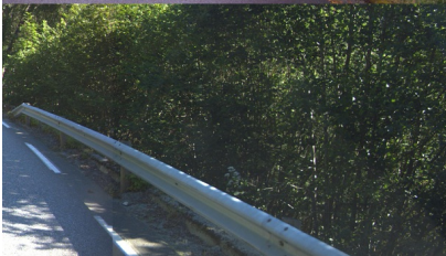
Redusert klippebredde på grunn av busker og trær.