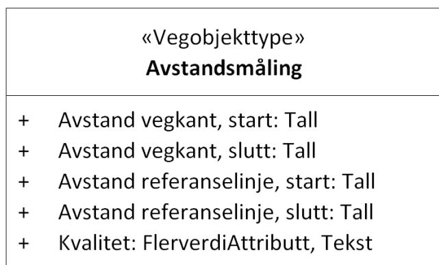
Figur 1: UML-skjema Avstandsmåling