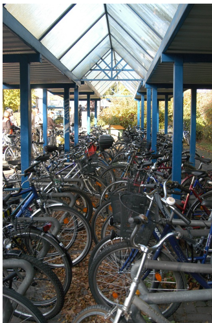
Stor sykkelparkering.