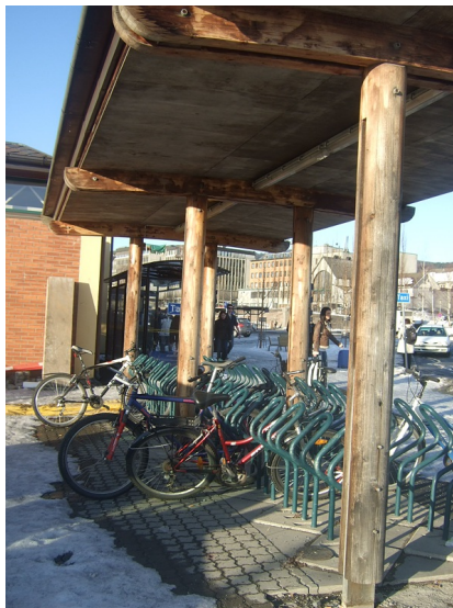
Sykelstativ under tak.