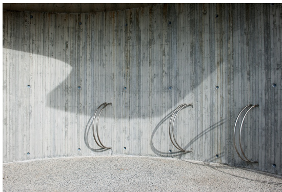
Sykkelparkering på rasteplass.