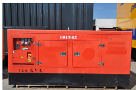
Stasjonært strømaggregat.