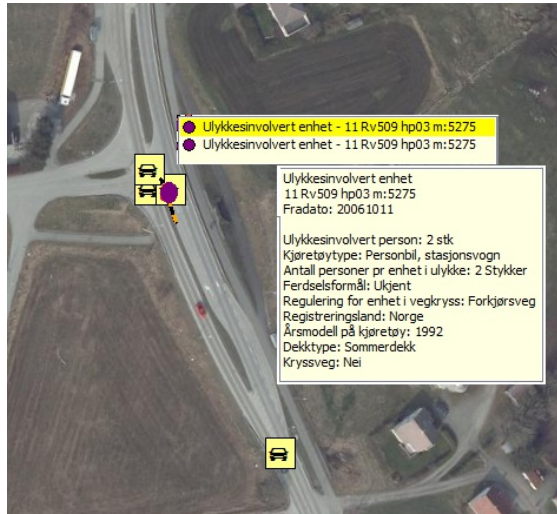
Figur 3: Data for ulykke med 2 ulykkesinvolverte enheter

Eksemplet viser data fra en trafikkulykke med to enheter involvert i ulykken. Vi ser her at det er to personer involvert i den ene bilen, og disse vil da finnes igjen som ulykkesinvolvert person.