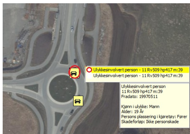
Figur 3: Data for en ulykkesinvolvert person

Her vises data for den ene av to ulykkesinvolverte personer i en ulykkesinvolvert enhet