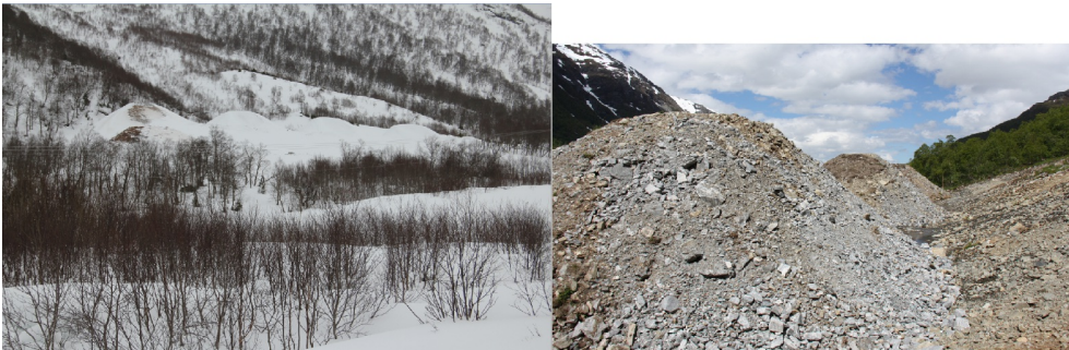
Figur 3: Eksempler på bremsekjegleregler.

Adkomst: Hjullaster Antall: 10 Antall rader: 2 Byggepr: 1992 Helning støtside kjegle: 50 grader Høyde støtside kjegle: 2.5 meter Kjeglereglerform: Rund Lengde bunn kjegle : 8 meter Materialtype støtside: Grus