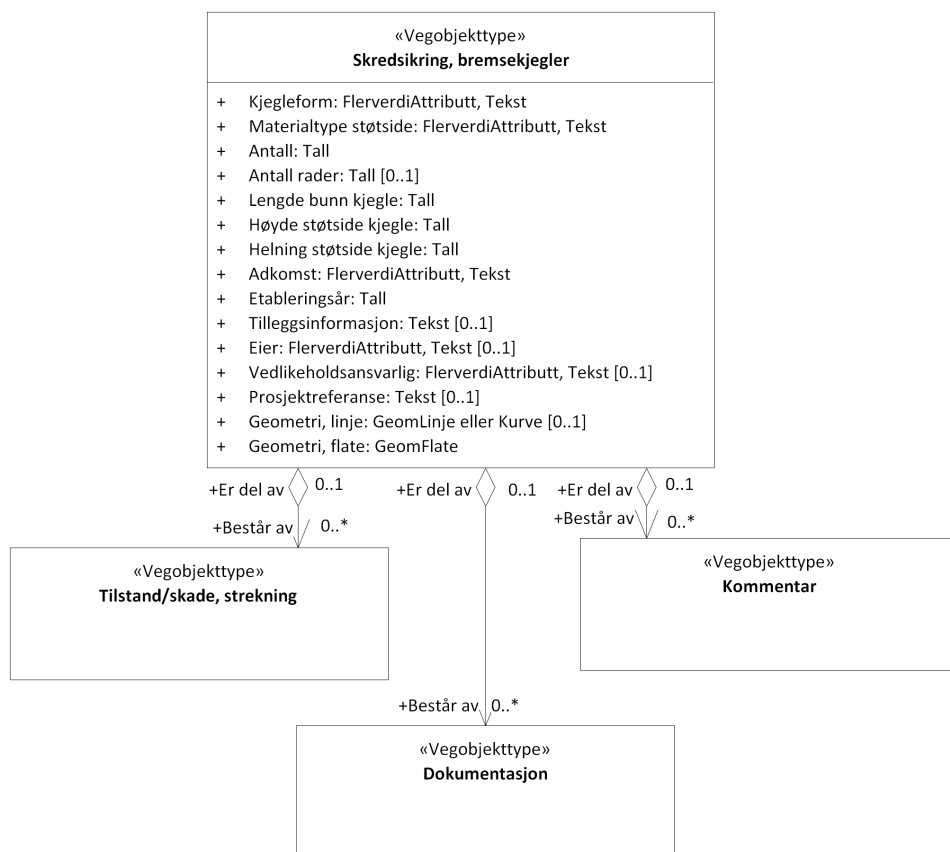
Figur 3: UML-skjema med assosiasjoner