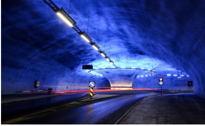
Lyssetting i Vallaviktunnelen.

Bildet viser eksempel på en moderne og litt spektakulær lyssetting i en rundkjøring i Vallaviktunnelen. For å kunne skille ut effektbelysning kan det være lurt å registrere noen av de opsjonelle egenskapene som Fargetemperatur