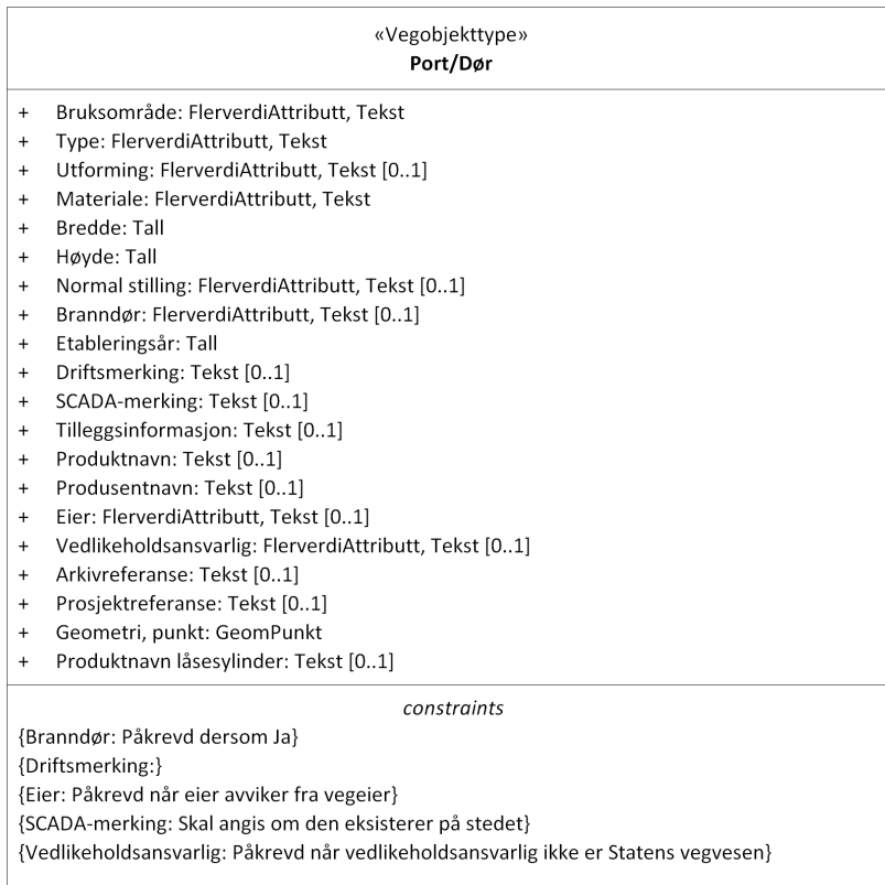
Figur 1: UML-skjema med betingelser