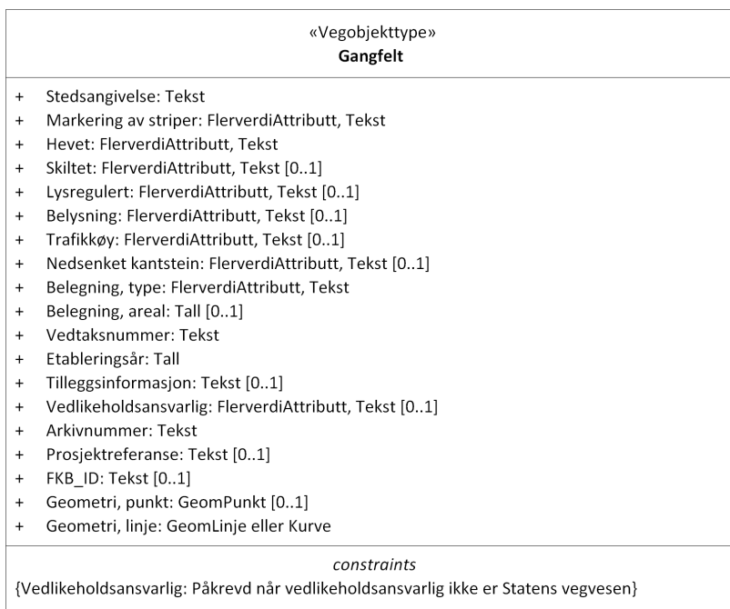
Figur 1: UML-skjema med betingelser