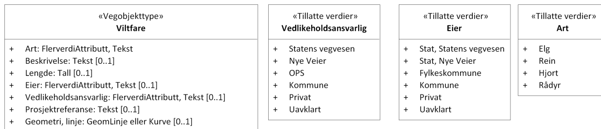
Figur 2:UML-skjema tillatte verdier