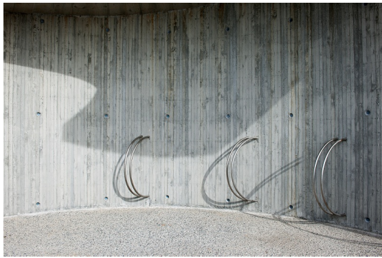
Sykkelparkering på rasteplass.