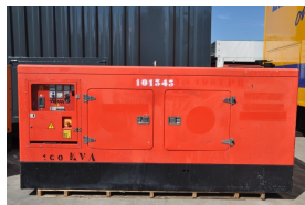
Stasjonært strømaggregat.

Driftsattår: 2011 Driftsmerking: NS2605 Effekt: 100 KVA Produktnavn: UCI 224G14 Produsentnavn: Stamford Type: Stasjonært