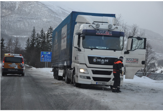
Plass for å ta av og på kjetting er markert med skilt 780 Kjetting (Håndbok N300 Del 1 Fellesbestemmelser)