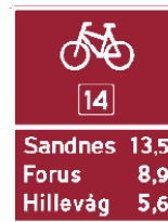
Visningsskilt for sykkelruter, skilt 751, 753, 755, 757