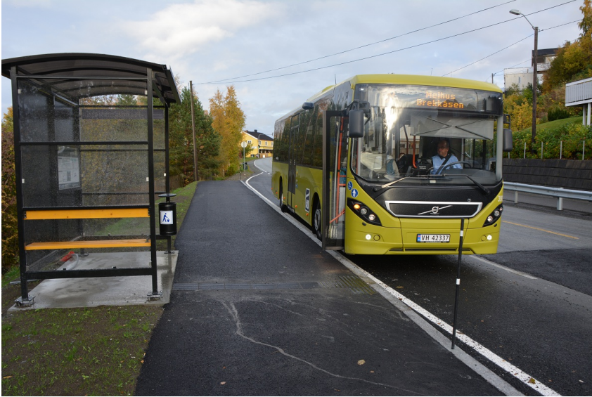
Figur 5: Eksempel på plattform ved busslomme (Hundhammeren i Malvik kommune).

Areal: 100 Belegning: Asfalt Bredde: 2,5 Lengde : 40 Type: Plattform