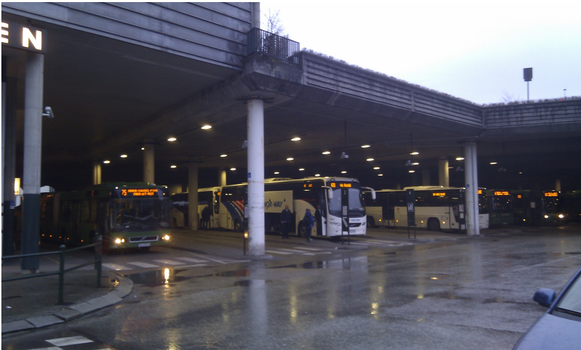
Figur 3: Repos/Venteareal på kollektivterminal

Bildet viser flere venteområder under tak i kollektivterminal.