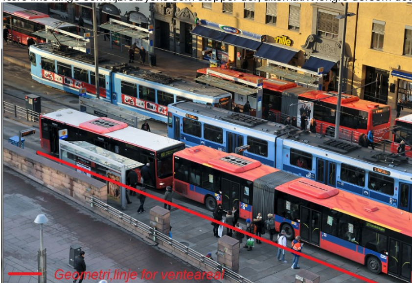
Figur 6: Flere Repos/Venteareal på kollektivknutepunkt

Der det er mange Stoppunkter på et lite område, må det registreres et Repos/Venteareal for hvert separate område. Reposene bør være like lange som kjøretøyene som stopper der, alternativt lengre dersom det er vanlig at flere kjøretøy stopper der samtidig.