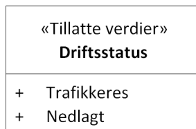
Figur 2: UML-skjema tillatte verdier