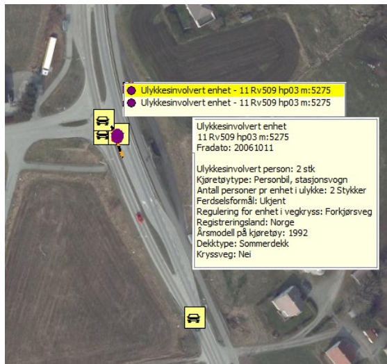
Figur 3: Data for ulykke med 2 ulykkesinvolverte enheter

Eksemplet viser data fra en trafikulykke med to enheter involvert i ulykken. Vi ser her at det er to personer involvert i den ene bilen, og disse vil da finnes igjen som ulykkesinvolvert person.