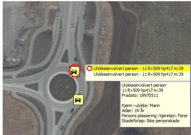
Figur 3: Data for en ulykkesinvolvert person

Her vises data for den ene av to ulykkesinvolverte personer i en ulykkesinvolvert enhet