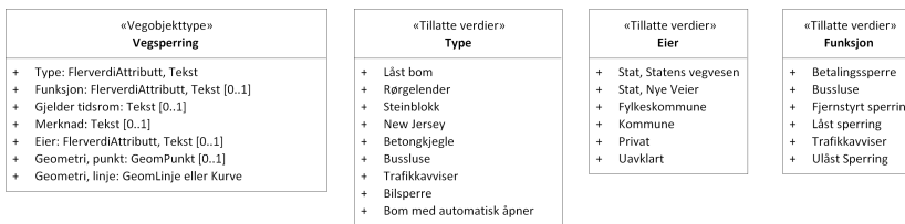
Figur 2: UML-skjema tillatte verdier