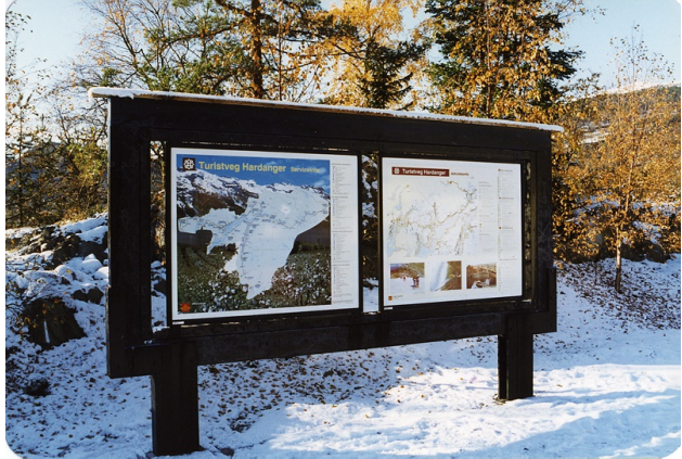
Stativ for turistinfo i Hardanger.

Antall infoplater : 2 Belyst : Nei Fundamentering: Stolpefundament Materialtype: Metall Overflatebehandling: Ubehandlet Plexiglass utenpå infoplater: Nei Stedsangivelse: Stegabakken Tak: Nei