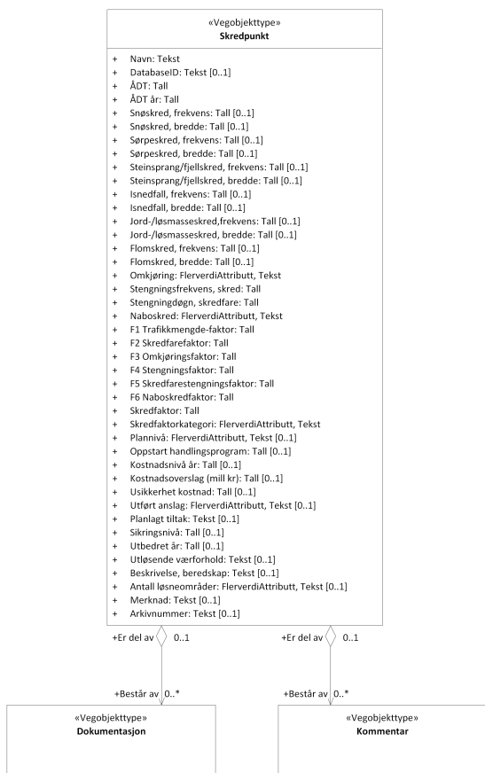
Figur 3: UML-skjema med assosiasjoner