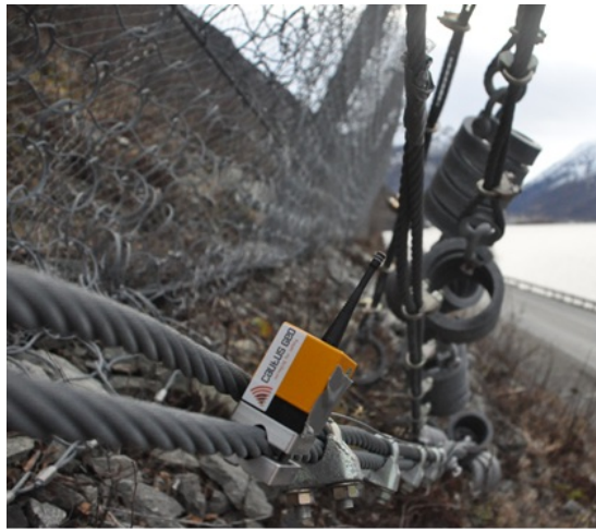
Figur 4: Rystelsesmåling på fanggjerde.

Type naturfare: Steinsprang/skred Overvåkningstype: Rystelsesmåling Varsling på veg: Ingen Adkomst : Kran