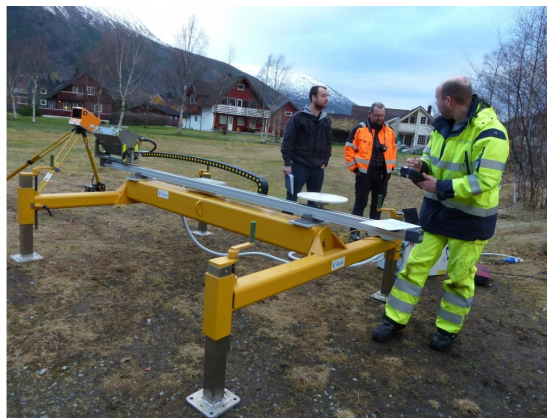
Figur 3: Utstyr for skredvarsling med radar

Eksemplet viser utstyr for skredvarsling basert på radar. Enheten har også tilknyttet GPS og laserscanner.