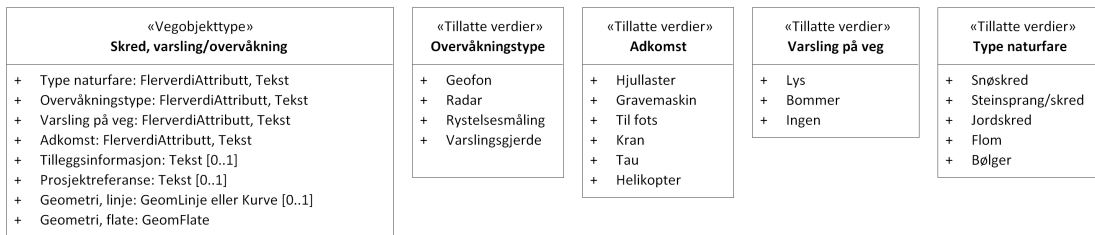
Figur 2: UML-skjema tillatte verdier